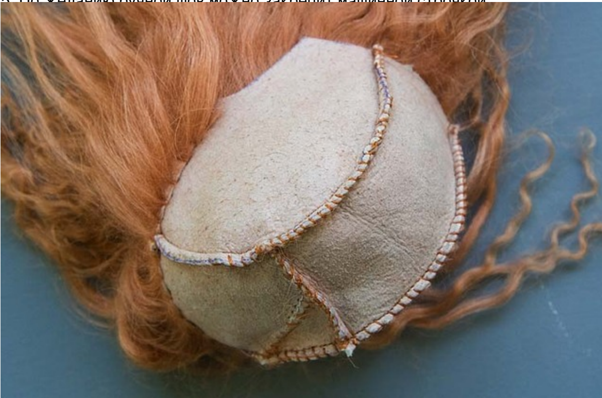
6. Крепить парик можно на измазанную резинку бычьей кожи или на резинку. Если кожа