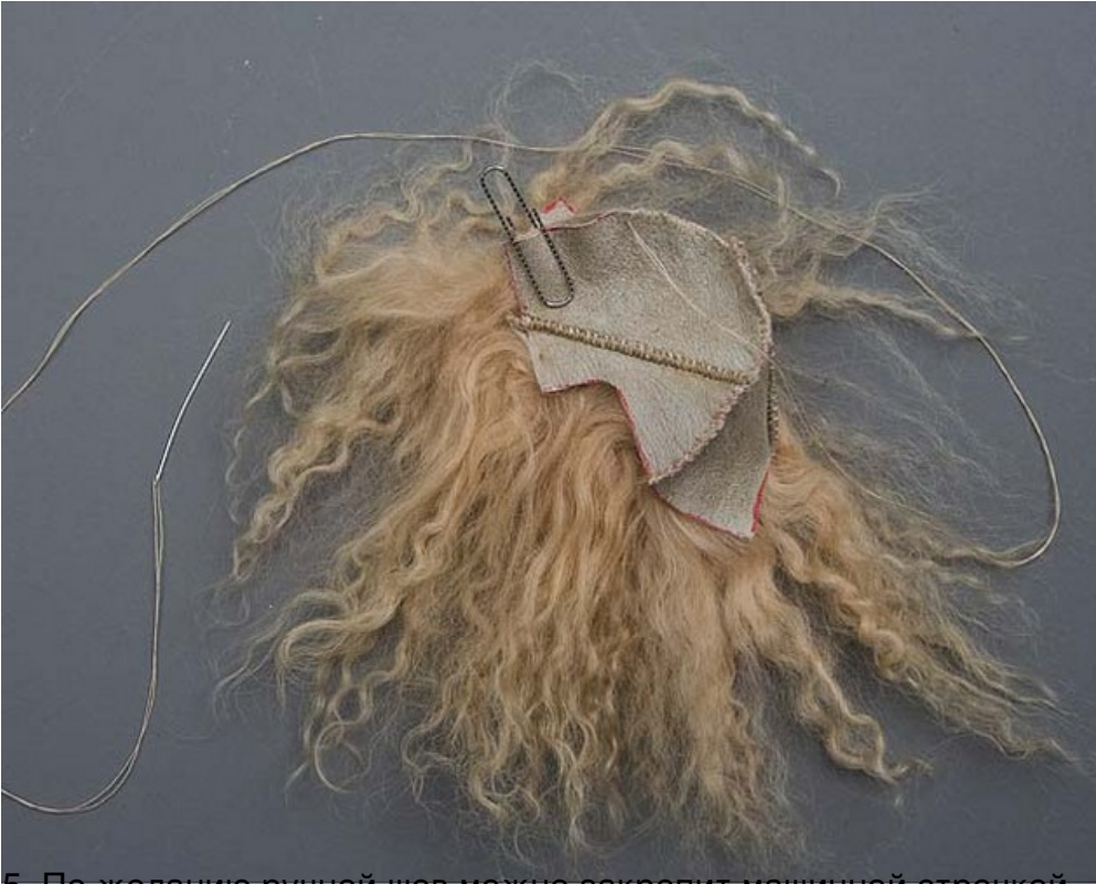
5. По желанию ручные швы можно закрепить машинной строчкой